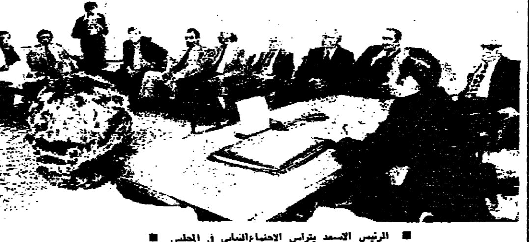
الرئيس الاسعد يترأس الاجتماع النيابي في المجلس